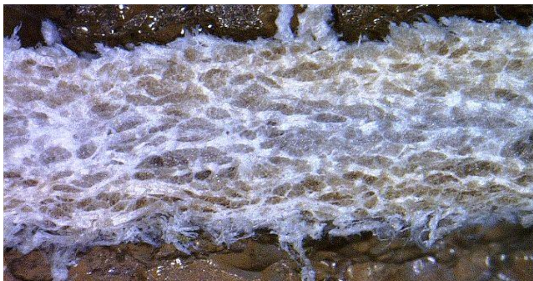
Рис. 5 Поперечный срез материала стельки: коженные волокна