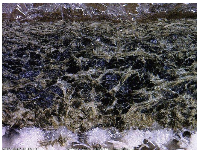
Рис. 3 Поперечный срез кожи верха обуви