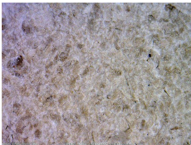
Рис. 4 Внешний вид материала стельки