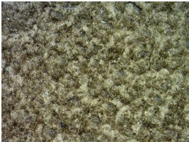
Рис. 1 Внешний вид материала верха обуви

Обувь детская код 15П030524: сандалеты для детей от 3 до 5 лет (малодетские)